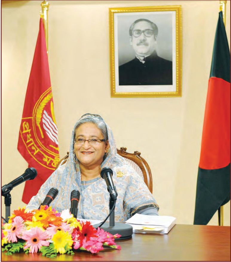
গণপ্রজাতন্ত্রী বাংলাদেশ সরকারের মাননীয় প্রধানমন্ত্রী শেখ হাসিনা